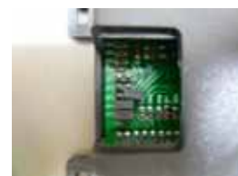
左の写真はJP3がオープンでJP4、JP5がショートの場合(JP1、JP2のみ使用)

設定0:ジャンパーターミナル(黒い樹脂)を付ける 設定1:ジャンパーターミナルを外す