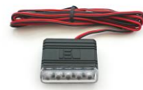
DEI 629L ブルーLED スキャナ