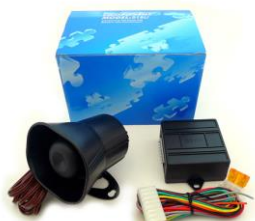
DEI 516U ボイスモジュール