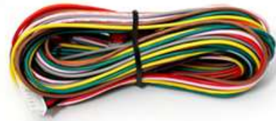
CN1 12ピンハーネス 1セット