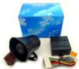
DEI 516U ボイスモジュール