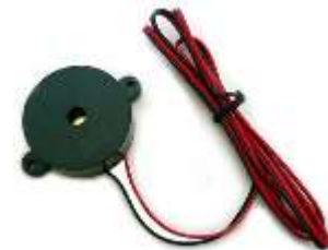
電子ブザー 1セット