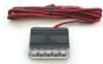
DEI 629L ブルーLED スキャナ