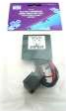
DEI620V EL スキャナ DEI620C EL スキャナ