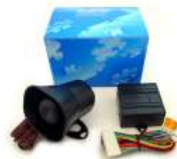
DEI 516U ボイスモジュール