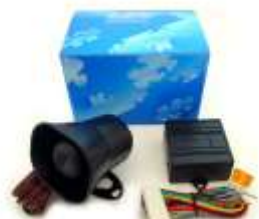
DEI 516U ボイスモジュール