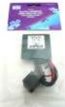
DEI620V EL スキャナ DEI620C EL スキャナ